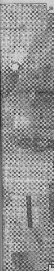
Autoridades, directivos y ejecutivos durante el brindis de inauguración.