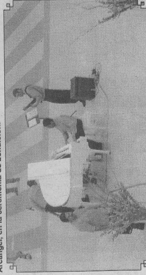
La música de piano sirvió de fondo musical par el evento. correo electrónico:semanario_sebusca@hotmail.com