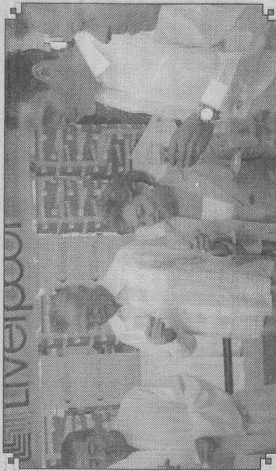
Autoridades, directivos y ejecutivos durante el brindis de inauguración.