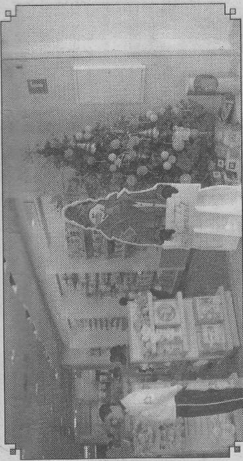
Los detalles navideños ya se pueden observar en cada departamento.