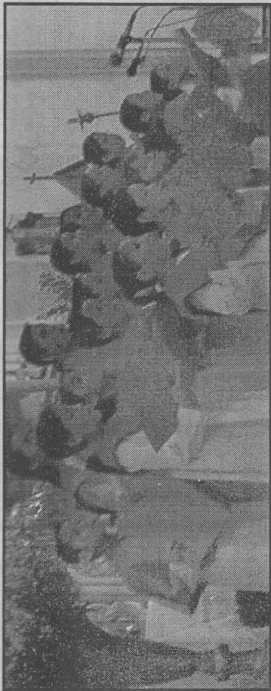
Grupo coral de niños de la parroquia de Nuestra Señora de Guadalupe.

Un concierto que resultó un buen regalo de Día de Reyes.